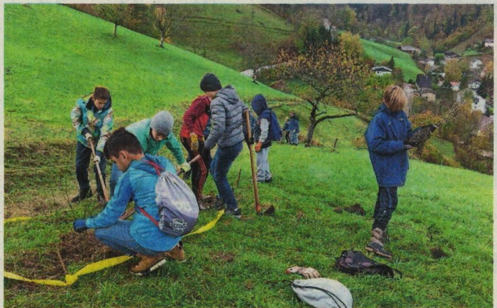
Die Junioren des FC Oberdorf pflanzten eine Dornhecke.